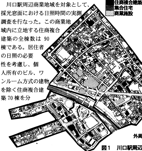
図1 川口駅周辺商業地域の住商複合建築の分布

川口駅周辺商業地域を対象として、採光窓面における日照時間の実測調査を行なった。この商業地域内に立地する住商複合建築の全棟数は90棟である。居住者の日照の必要性を考慮し、個人所有のビル、ワンルーム方式の建物を除く住商複合建築70棟を分